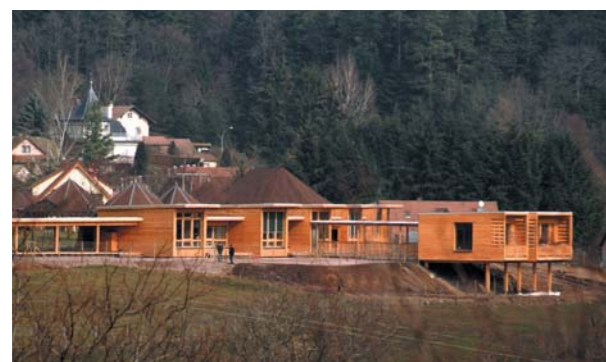
▲ Installée dans la pente, l'école se tourne vers la vallée.

En contrebas du centre historique, l'école s'étire le long des courbes de niveau en suivant le tracé de l'ancien parcellaire façonné par des vergers séculaires. D'où un épannelage inhabituel de la volumétrie : les salles de classe, adossées au talus nord, se déploient en éventail selon un plan en arc